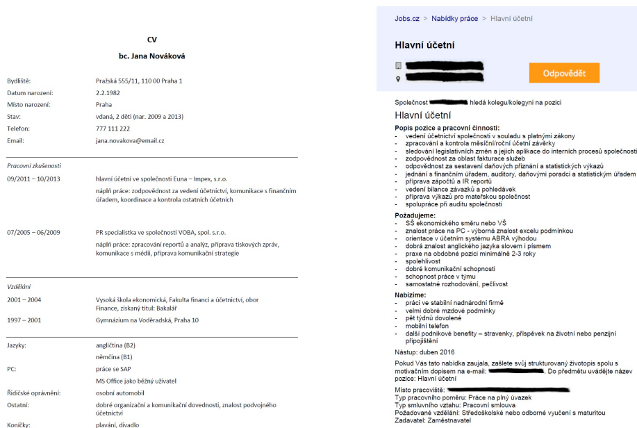
(a) CV Nováková